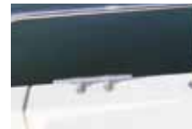
船首クリート/船尾クリート