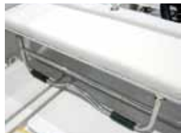
スタンシート ゲスト用に便利な折りたたみ式シート。