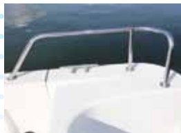
スタンレール ボート後部の左右に取付。