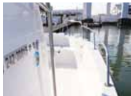
バウレール (延長部)