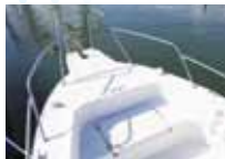
バウレール (前部) ※延長部はオプションです

オーソドックスなセンターコンソールタイプのデッキレイアウトが、遊びの幅を広げ、様々なニーズに対応します。