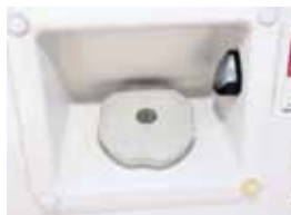
100L 燃料タンク 写真は鍵付きの給油口です。