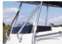
ウィンドシールド ※Tトップ及びグリップはオプションです