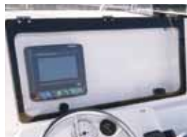
航海計器ボックス ※航海計器は含まれません その他オプション