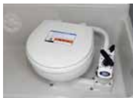
手動マリントイレ