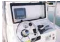
センターコンソール ※航海計器及びボックスはオプションです