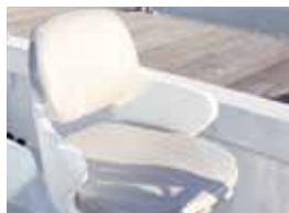
ドライバーズシート