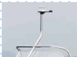
航海灯 (ウィンドシールド用) (ステーを含む)