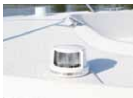
航海灯 (炫灯) (Tトップ有無共通)