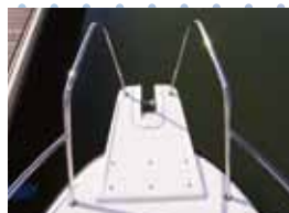
バウスプリット ローラーは別途になります。